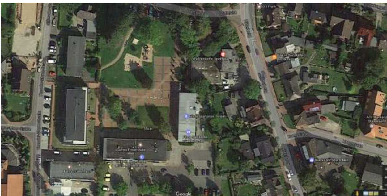
Ortsmitte in Wankendorf