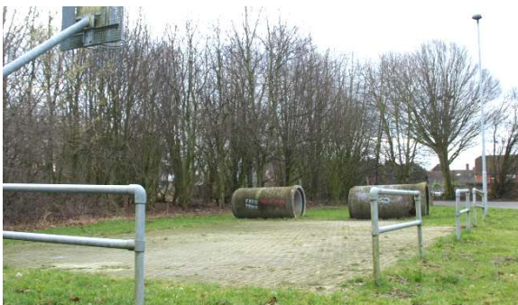
Basketballplatz an der Schule

Im Hinblick auf Jugendeinrichtungen, darunter auch die Grundschule, ist Anpassungsbedarf gegeben. Die Auslastung / Nutzung von Einrichtungen geht zurück.