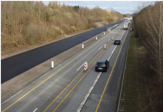
Entwicklungsachse BAB 21 Bargtheide-Kiel bei Wankendorf und Stolpe

Der ländliche Zentralort Wankendorf liegt verkehrsgünstig an der Landesentwicklungsachse Bargtheide – Kiel unmittelbar an der BAB 21. Die Fahrzeit nach Hamburg beträgt knapp 1 Stunde. Das Wankendorfer Seengebiet gehört zum Vorbehaltsraum für Natur und Landschaft. Im Regionalplan ist der ländliche Zentralort im ländlichen Raum als Gebiet mit besonderem Vorrang für Tourismus ausgewiesen.